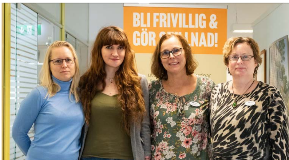
Personal och frivilliga på frivilligcentralen